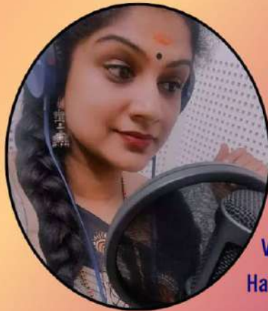
Ms Devi S. Dubbing Artiste

Voice Workshop/ Hands on Experience in Dubbing